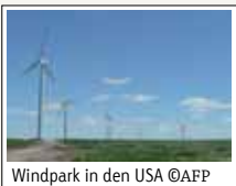
Windpark in den USA